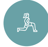
PARQUE DE CALISTENIA