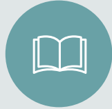
ZONA DE LECTURA