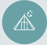
ÁREA DE CAMPING