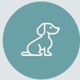
PARQUE DE MASCOTAS