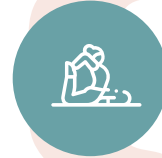
ÁREA DE YOGA